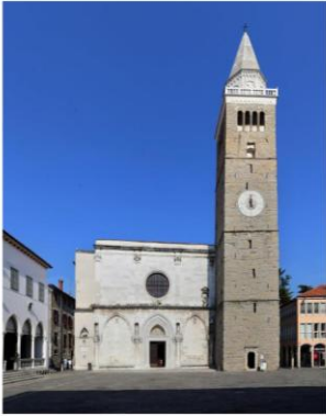
- Zvonik v Kopru (12. stol., 15. stol.), višina: 53 m