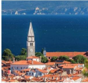
- Zvonik v Izoli (1585), višina 39 m